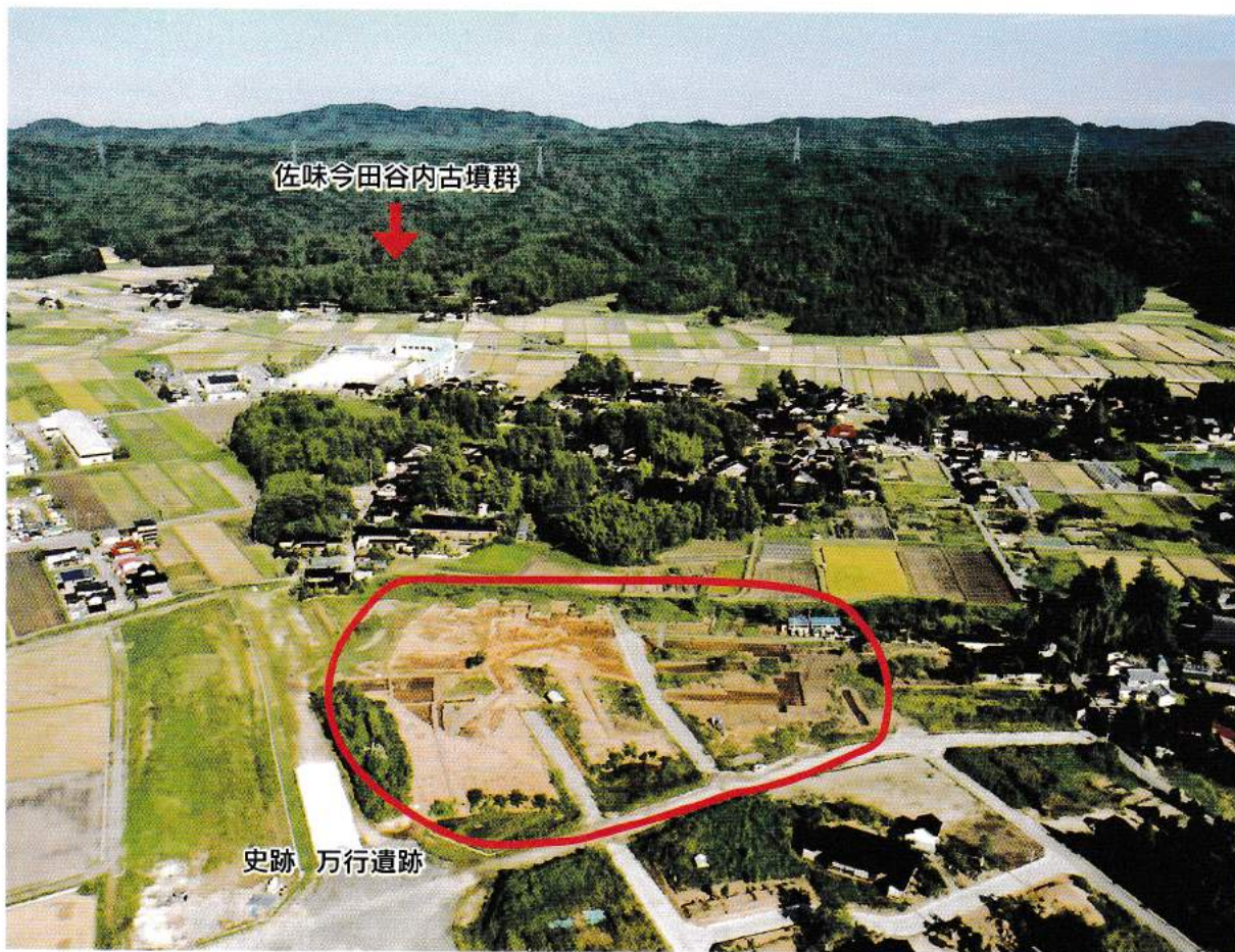
万行遺跡から佐味今田谷内古墳群を望む（西から）