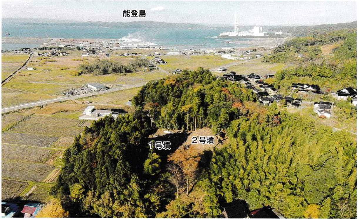
佐味今田谷内古墳群上空から七尾南湾を望む（南から）